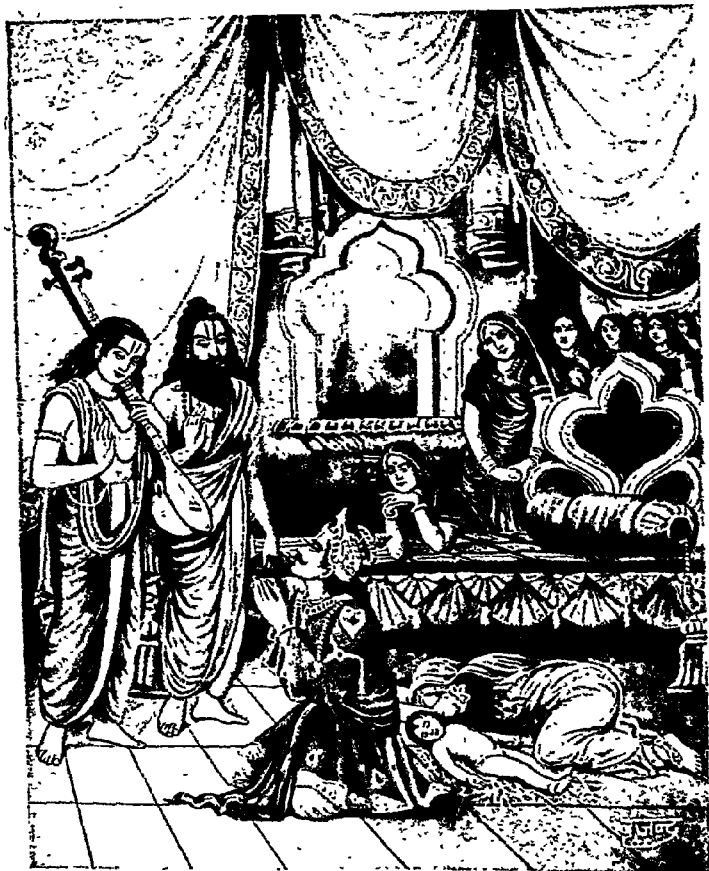
महर्षि अङ्गिरा और देवर्षि नारदका राजा चित्रकेतुको समझाना [पृष्ठ ११७]